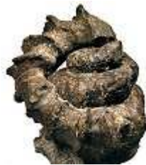
Muramotoceras yezoense (ammonite)

1) Muramotoceras est la première ammonite hétéromorphe typique de l'Hokkaido. Elle se trouve dans les strates du Turonien. Muramotoceras luxum est peut-être l'espèce ancienne, suivie par Muramotoceras yezoense ainsi que d'autres espèces non décrites. M. luxum est un petit hétéromorphe avec 4 rangées d'épines et un enroulement unique; la première partie droite est suivie de plusieurs hélicoides puis tourne en forme de U pour la chambre d'habitation. M. yezoense ressemble à M. luxum, mais sans la forme de U de la chambre d'habitation. Concernant M. yezoense , sa taille adulte est devenue énorme avec le temps.