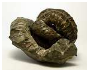
Nipponites mirabile (ammonite)