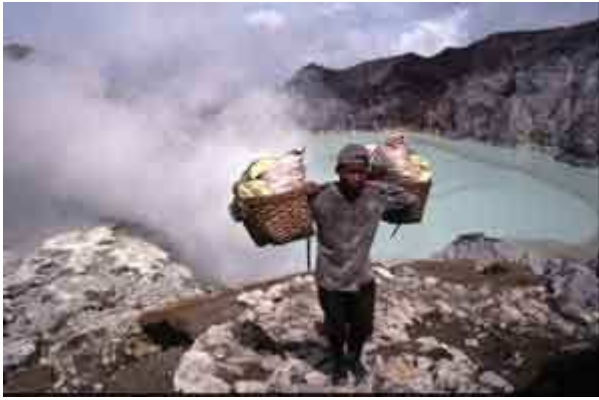
Un porteur de soufre au Kawah Idjen en Indonésie

- En région péri-volcanique, l'énergie du sous-sol peut être exploitée : c'est la géothermie. La première centrale a fonctionné en 1904 à Larderello, Toscane, Italie. De nombreux pays sont concernés (Islande, USA, Russie, Japon, Mexique, Philippines , etc.)