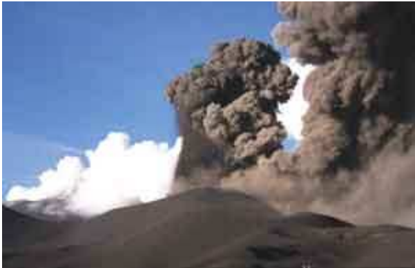
Explosion vulcanienne sur l'Etna en Italie en novembre 2002

- Les éruptions de type vulcanien (référence au Vulcano, également dans les îles éoliennes) projettent des cendres grises, fines (taille de l'ordre du millimètre), jusqu'à quelques kilomètres de hauteur.