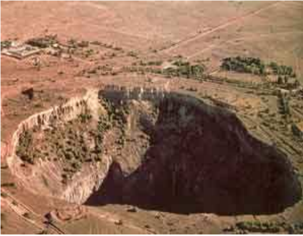
Cheminée diamantifère de Kimberley en Afrique du Sud. La mine, creusée dans une cheminé volcanique, a un diamètre de 400 mètres.