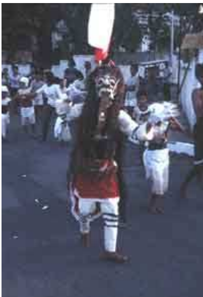
Le volcan est encore déifié de nos jours comme lors de cette procession en Indonésie