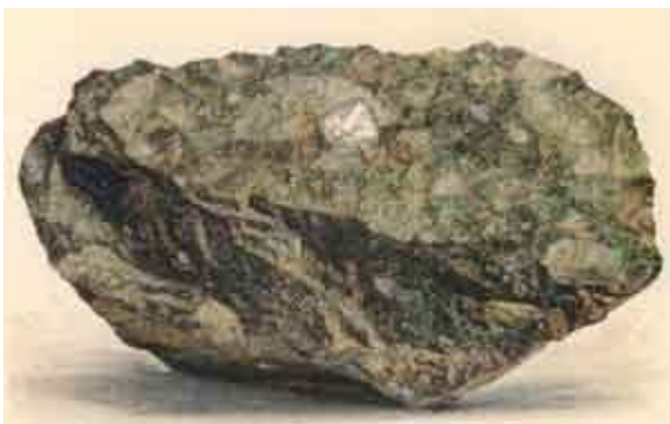
Dessin naturaliste d'un diamant cristallisé en octaèdre dans sa roche mère volcanique, la kimberlite.