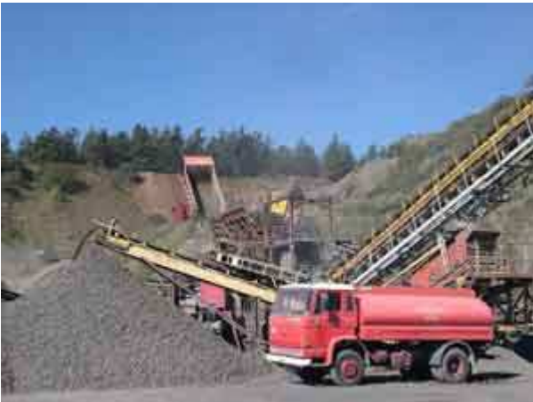
Carrière ouverte en Haute-Loire dans un ancien lac de lave.