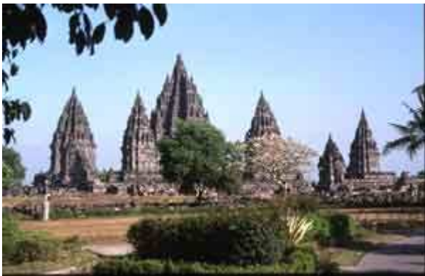
Edifice en Indonésie construit en roche volcanique

- Les volcans anciens ont laissés d'importants gisements métallifères (or, cuivre au Chili). Le soufre est exploité au Kawah Idjen en Indonésie (6 tonnes de soufre sont exploités chaque jour par des hommes, les « forçats » du soufre ; le soufre est renouvelé par les fumerolles).