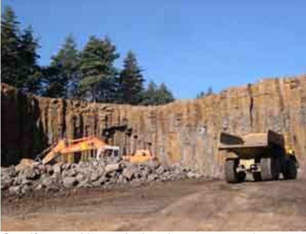
Carrière en Haute-Loire dans une ancienne coulée volcanique, faite d'orgue basaltique.