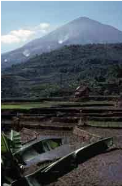
Rizières sur des terrains fertiles au pied du volcan Cikuray en Indonésie

- Les volcans construisent des territoires nouveaux (îles volcaniques : Antilles, Réunion, Tahiti, Islande, Kerguelen, etc.). Les sols volcaniques sont très fertiles (2 à 3 récoltes de riz par an en Indonésie au pied des volcans contre une seule récolte en Inde).