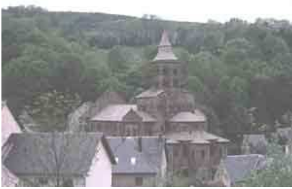
La cathédrale d'Orcival en Auvergne construite en pierres volcaniques noires