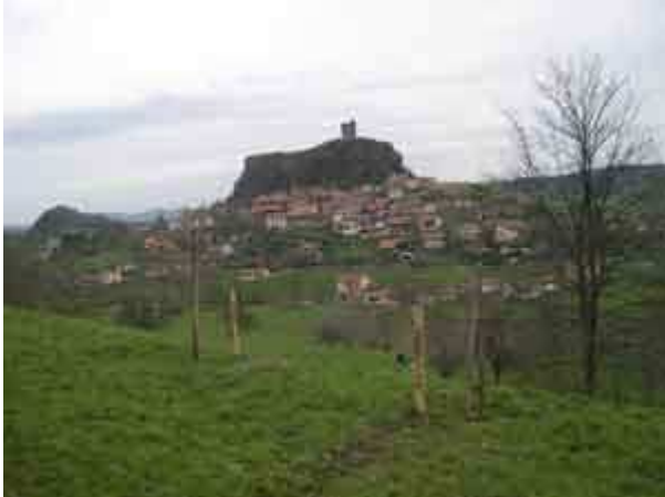
Château de Paulignac en Haute-Loire, construit sur un piton volcanique