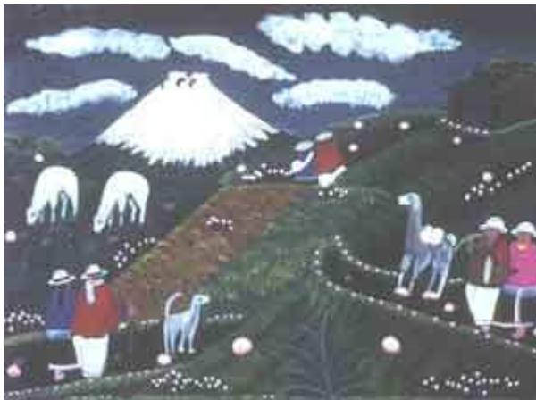
Tableau artisanal équatorien

- Les pierres volcaniques ont été sculptées (moaïs géants dressés sur l'île de Pâques, statuettes mayas d'obsidienne). Le volcan a inspiré les artistes et les poètes (peintures italiennes, estampes japonaises, batiks de soie indonésiens).