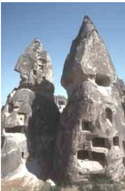
A üçhisar, dans la Cappadoce turque, des cheminées de fées, formées de cendres volcaniques soudées puis sculptées par l'érosion, ont été creusées en habitats troglodytes

- Les volcans servent, depuis toujours, à l'habitat : abris préhistoriques sous des coulées volcaniques, situées en relief par le jeu de l'érosion et déchaussées progressivement à leur base ; habitats troglodytes (Cappadoce turque) ; pierres de construction : villes d'Auvergne en pierres (laves) noires ou grises (Clermont-Ferrand, Salers), parfois aussi en ponce claire (églises de Saint-Nectaire, La Bourboule).