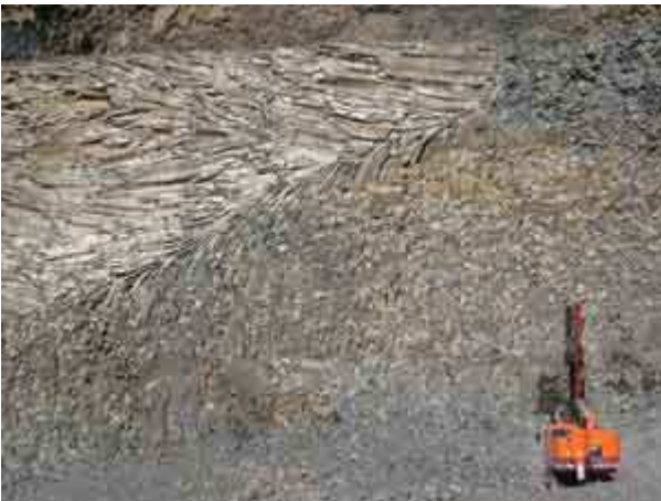
Le lac de lave de la carrière, les mouvements de la roche (en orgue) correspondent au mouvement de convection du lac.