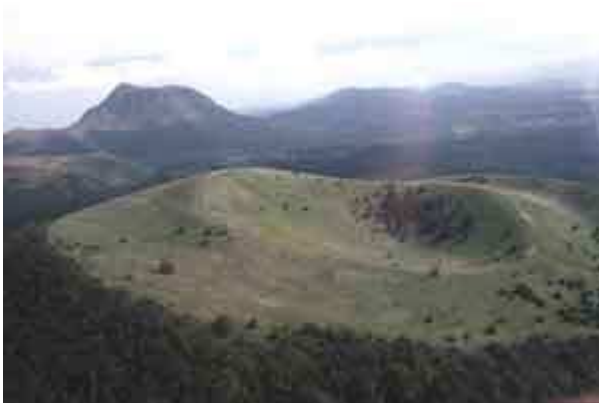
Volcans en France : le Puy de Dôme (au fond) et de Cône (au premier plan)