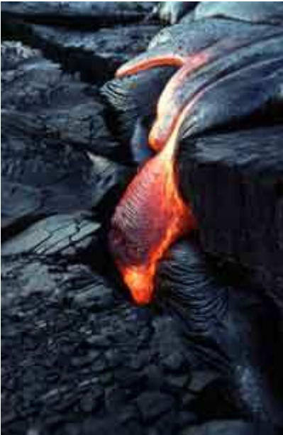
Front d'une coulée fluide, si la surface de la lave a commencé à refroidir (en noire), en dessous, la lave reste en fusion