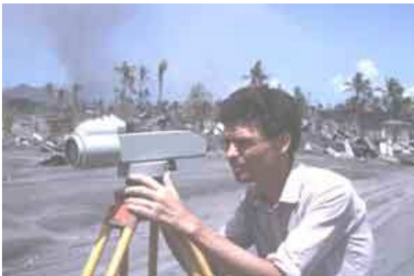
Jacques-Marie Bardintzeff utilisant un géodimètre (éruption du Tavurvur, Papouasie – Nouvelle-Guinée, 1996)

Les fumerolles peuvent changer de température, de composition ou de débit , annonçant une variation de l'activité du volcan. Les sources tout alentour peuvent également subir des modifications.