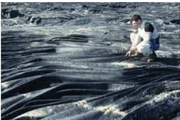
Coulée de lave figée en amas de corde (lave cordée) de grande ampleur (Hawaii)

Certaines laves, très fluides, sont appelées « pahoehoe » : ce terme hawaïien signifie qu'il est aisé de marcher sur la coulée quand elle est refroidie et solidifiée car sa surface est relativement plane, mimant parfois un amas de cordes («lave cordée»). Au contraire, les laves visqueuses « aa » (autre terme hawaïien) laissent des surfaces de coulées très irrégulières , rendant toute progression difficile.