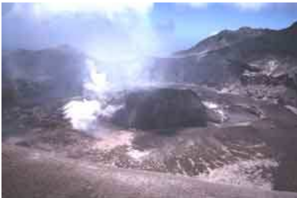
Un dôme de lave visqueuse se met en place dans le cratère de la Soufrière de Saint-Vincent aux Antilles lors de sa crise éruptive d'avril - mai 1979

Certaines laves, trop visqueuses pour s'écouler, construisent des dômes ou des aiguilles de lave.