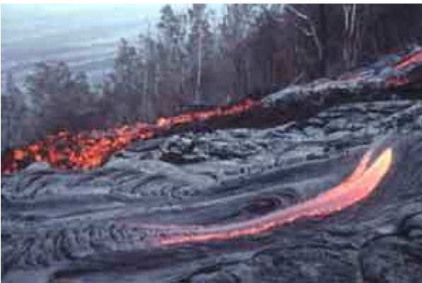
Lave « pahoehoe » au premier plan, « aa » au second.