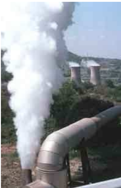
Centrale géothermique de Larderello, Toscane, Italie

- En région péri-volcanique, l'énergie du sous-sol peut être exploitée : c'est la géothermie. La première centrale a fonctionné en 1904 à Larderello, Toscane, Italie. De nombreux pays sont concernés (Islande, USA, Russie, Japon, Mexique, Philippines , etc.)