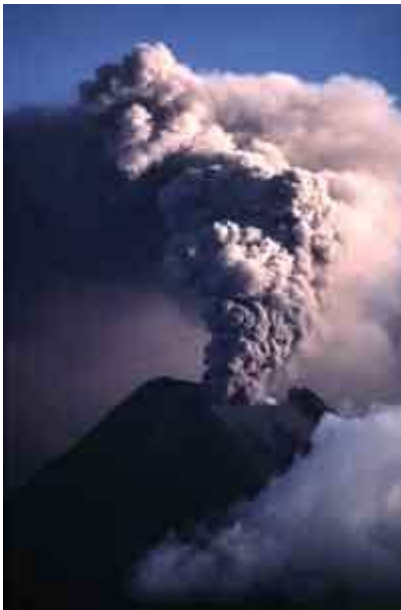
Le Tungurahua (5 016 mètres) en Equateur, en éruption le 1er novembre 1999

- Les éruptions de type plinien (référence à Pline l'Ancien et Pline le Jeune, observateurs de l'éruption du Vésuve, qui, en 79 ap. J.-C., détruisit Pompéi) projettent des ponces (fragments de roches légères car riches en vacuoles de gaz), jusqu'à 50 km de hauteur.