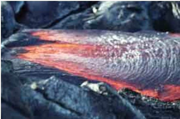
Coulée de lave à Hawaii, mimant un amas de cordes (lave cordée)

Elles libèrent des coulées de lave, liquide parfois pâteuse, à des températures de 900 à 1200 degrés. On parle de type hawaïien, en référence aux volcans d'Hawaii : Kilauea, Mauna Loa.