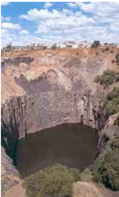
Le Big Hole à Kimberley en Afrique du Sud est la plus célèbre des cheminé diamantifère. Cette mine de 1,6 km de diamètre et 400 m de profondeur a été exploitée entre 1871 et 1914. Des 22,6 millions de tonnes de kimberlite extraites, on a retiré 3 tonnes de diamants...