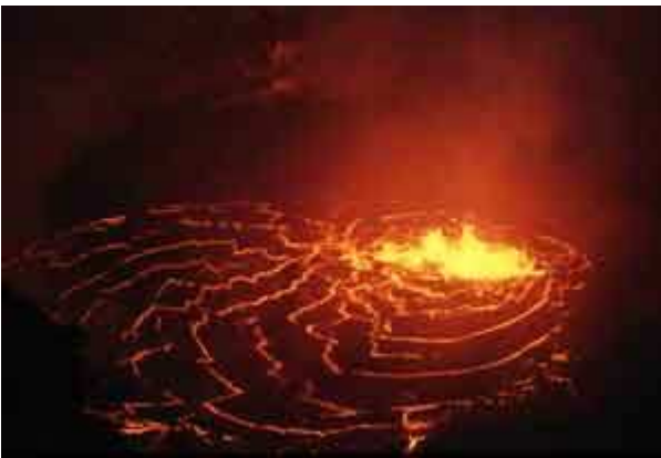
Lac de lave du Pu'u O'o, massif du Kilauea, Hawaii, mars 1993. La température est de l'ordre de 1150 degrés.