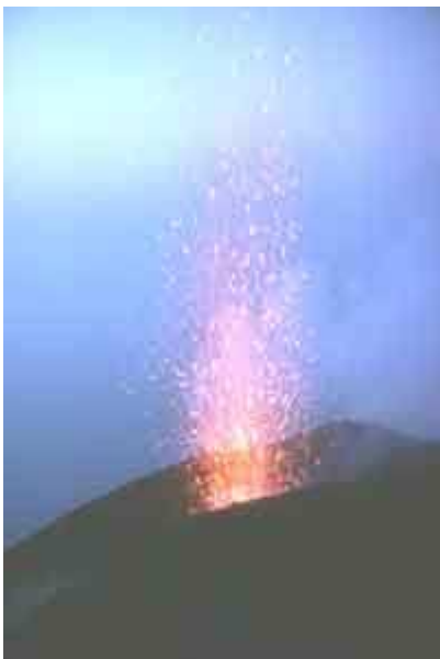
Explosion au Stromboli en Italie, qui a donné son nom au type strombolien.

- Les éruptions de type strombolien (référence au Stromboli dans les îles éoliennes en Italie) projettent des bombes incandescentes, dont la taille peut atteindre plusieurs mètres, à des hauteurs de plusieurs centaines de mètres.