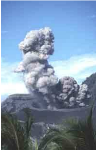
Tavurvur (Papouasie - Nouvelle-Guinée)