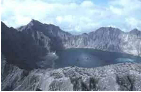
Cratère du Pinatubo aux Philippines