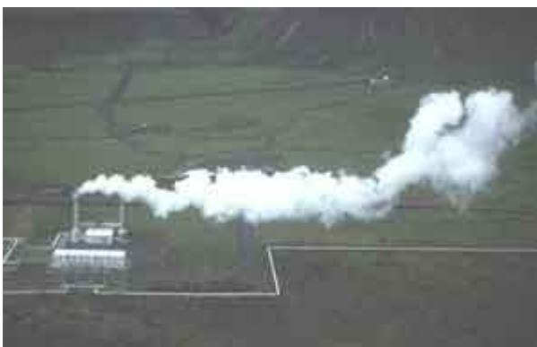
La géothermie est l'exploitation de la chaleur du sous-sol, comme à Nesjavellir en Islande

- Le volcan est aussi source de santé (thermalisme). De nombreuses stations thermales existent en Auvergne, pour le traitement de différents maux (Châtelguyon pour les troubles digestifs, La Bourboule pour les allergies respiratoires et cutanées, Le Mont-Dore et Chaudes-Aigues pour les rhumatismes, Saint-Nectaire pour les maladies rénales, Vals-les-Bains...). Au Japon, on les appelle des « onzen ».