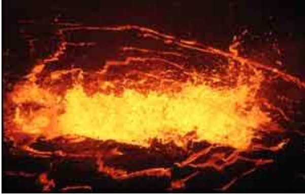
Lac de lave du Pu'u O'o, massif du Kilauea, Hawaii.

L'Oï Doinyo Lengai en Tanzanie est unique au monde car il émet des laves noires, appelées « carbonatites » (de composition chimique carbonatée), très fluides, à une température d'environ 500 degrés.