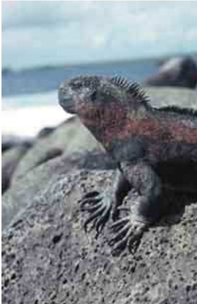
Iguane marin ( Amblyrhynchus cristatus ) se chauffant au soleil sur un rocher de basalte à Punta Suarez dans l'île d'Española aux Galapagos : un parc naturel protégé en région volcanique