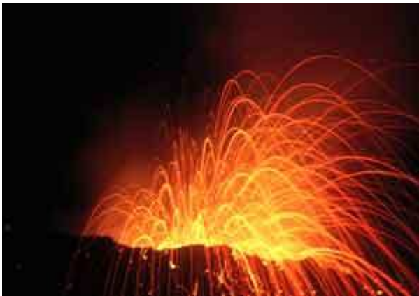
Explosion nocturne au piton Kapor (Piton de la Fournaise, île de la Réunion) en avril 1998